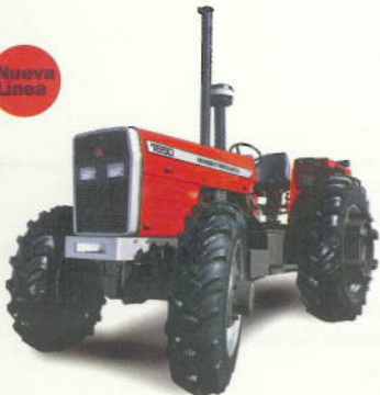
MF 1650 145 cv Doble y simple tracción SynchroPower MaxiComfort