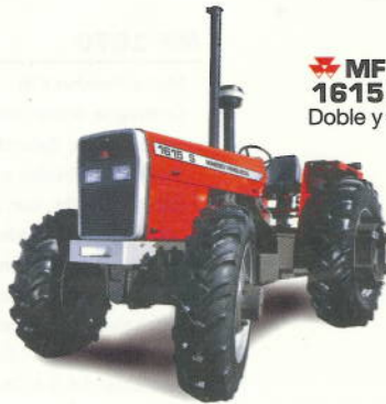
MF 1615 S y L 120 cv. Doble y simple tracción