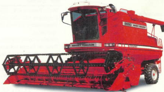
MF 6850 165 cv. 6855 210 cv.