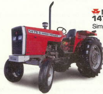
MF 1475 S 80 cv. Simple tracción