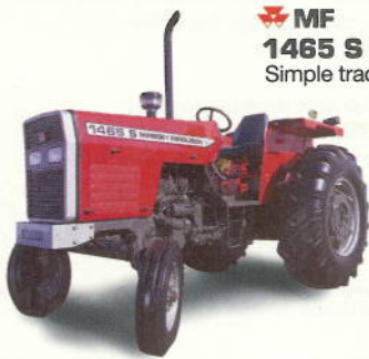
MF 1465 S 65 cv. Simple tracción

Aquí está el producto Massey Ferguson que usted necesita. Aproveche las condiciones de compra más favorables del mercado. Acérquese a su concesionaria.