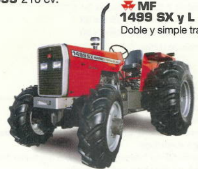
MF 1499 SX y L 110 cv. Doble y simple tracción