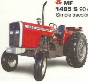
MF 1485 S 90 cv. Simple tracción