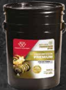
MF TRANSMISSION PREMIUM