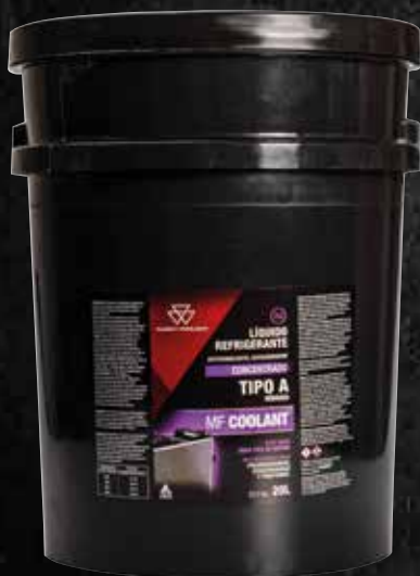
MF COOLANT 20 L

Su formulación perfectamente balanceada incluye inhibidores de corrosión tanto del tipo “tradicional” (inorgánico) como de última generación (orgánicos). Esta combinación, que se denomina habitualmente como “HÍBRIDA” posee la más avanzada tecnología a nivel mundial en refrigerantes para motores. Dada esta combinación no es necesaria la incorporación de suplementos anticorrosivos (SAC) en la carga inicial. Su fórmula es libre de fosfatos, boratos y aminas.