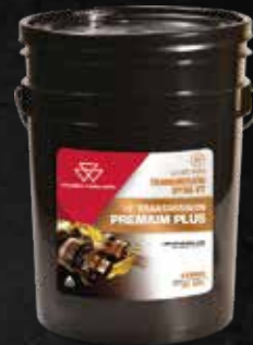
MF TRANSMISSION PREMIUM PLUS