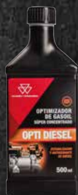
OPTI DIESEL 500 ML