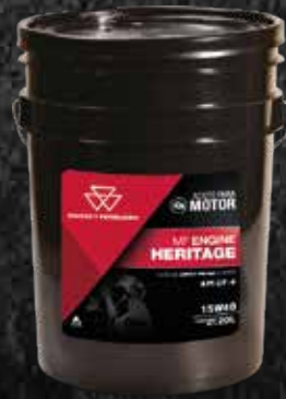
MF ENGINE HERITAGE