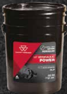
MF HYDRAULIC POWER

Al combinar correctamente los lubricantes originales con los Repuestos Genuinos AGCO Parts en tus máquinas Massey Ferguson, aumentarás los intervalos de cambio, lo que brinda más tiempo de actividad y reduce el costo por hora/hectárea trabajada.