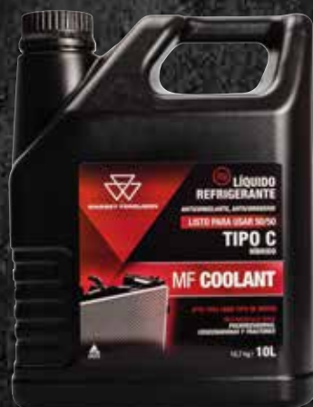
MF COOLANT 10 L