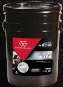
MF ENGINE ULTRA