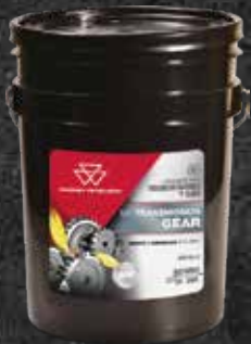
MF TRANSMISSION GEAR