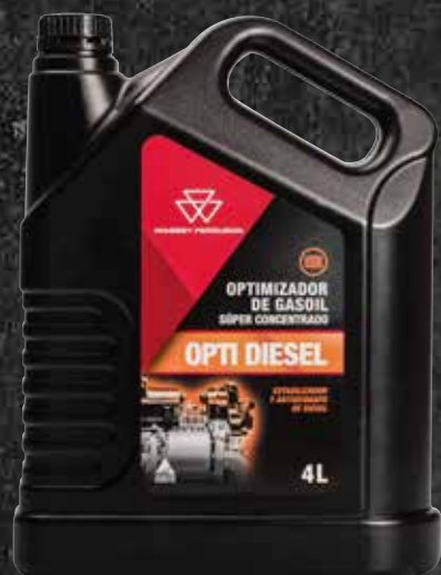
OPTI DIESEL 4 L